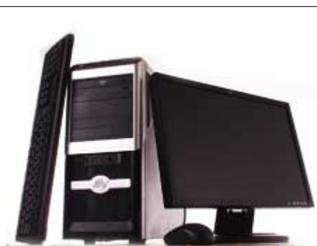
Llega el Computador Bolivariano