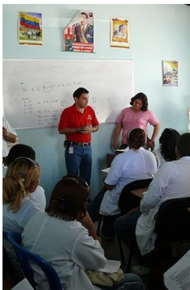
La Misión José Gregorio Hernández

En lo que va del año 2008, hasta el día de hoy se acumulan 159 mil 893 personas asistidas en Zulia, Barinas, Vargas,