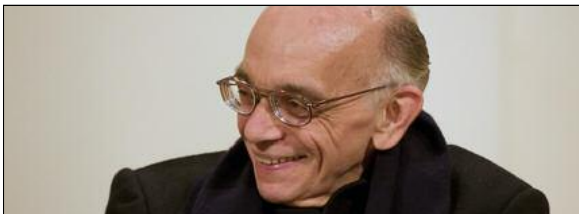
Maestro José Antonio Abreu

Mientras que el 15 de mayo, a partir de las 8:30 de la mañana, se presentará el "Proyecto de Sistema de Canadá Plan de Negocios".