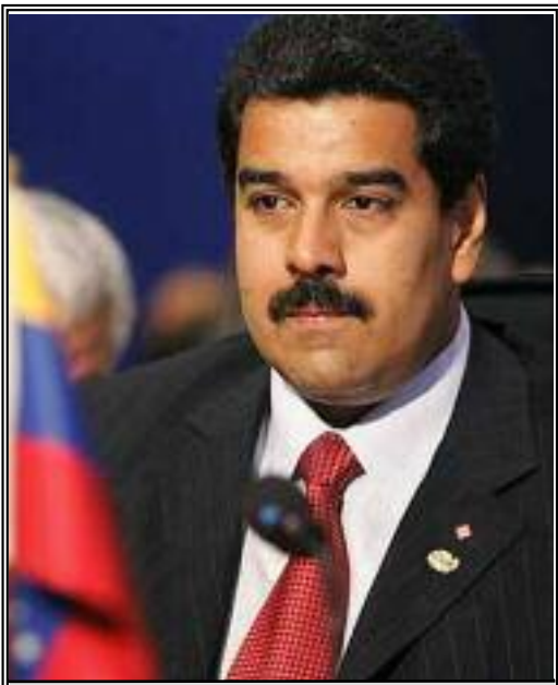
Nacen nuevas relaciones de cooperación comercial entre Caracas y las naciones andinas p.6