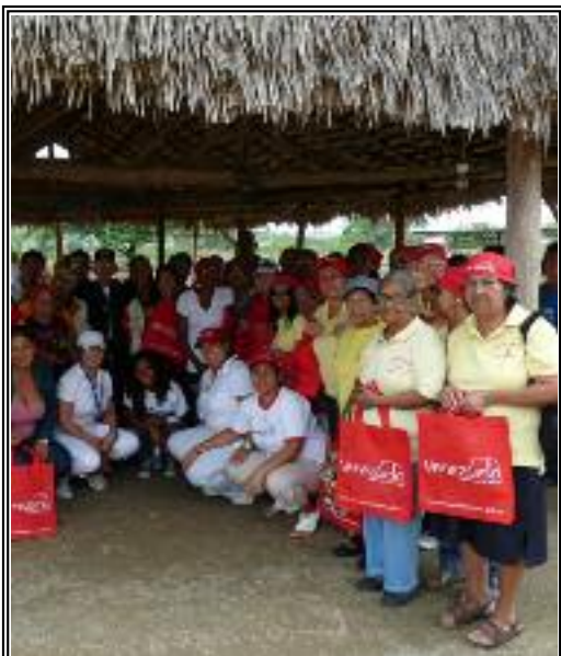
Turismo Social fortalece el desarrollo de la Patria Grande p.8