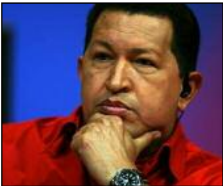
Presidente de la República Bolivariana de Venezuela