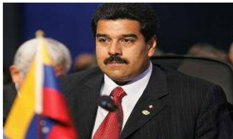
Canciller de Venezuela Nicolás Maduro