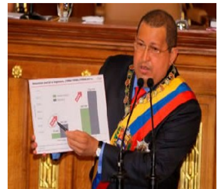
El presidente Hugo Chávez durante la presentación de la Memoria y Cuenta 2011 ante la Asamblea Nacional

Indicó que en la Gran Caracas (Caracas, Vargas y Miranda) están proyectadas 53 mil 973 viviendas para iniciar en breve. Reiteró que se cumplió el 96% de la meta de 2011, con más 146 mil techos dignos construidos y entregados a igual número de familias.